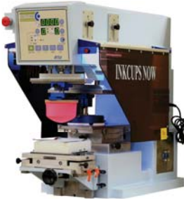
ICN B150 1 color, copa de 150mm

Inkcups Now ofrece una línea de impresoras semiautomáticas de tampografía, con modelos que van desde 1 a 6 colores. Las máquinas pueden ser equipadas con herramientas y accesorios diversos, incluso los hechos a la medida. Todas las impresoras vienen con los VersaCups – nuestras copas patentadas de tinta de diseño universal, que van desde 60 a 150mm para satisfacer diversas necesidades de producción. Las impresoras cuentan con sistema de desplazamiento del cabezal ajustable, retraso programable y cambios de placa o copa sin necesidad de herramientas.