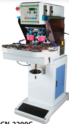
ICN-2200C 2 colores, con sistema de carrusel