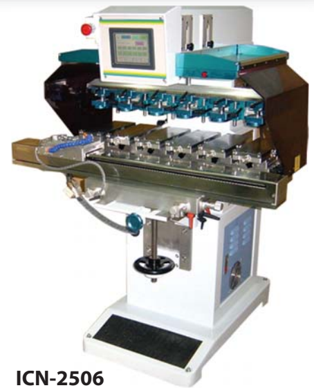
ICN-2506 6 colores