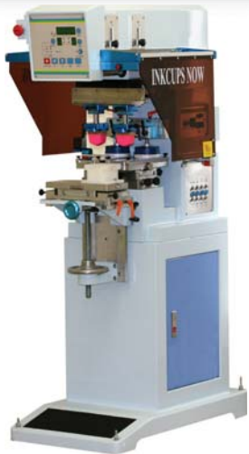
ICN-2200PS 2 colores, con tobogán de tampones

Todas las impresoras son capaz de comprimir tampones (pads) de impresión de gran dimensión, ofreciendo imágenes nítidas y de alta calidad. Las máquinas son fuertes y resistentes, ideales para el uso pesado, muy fáciles de usar no solo para un técnico con experiencia, pero también para un usuario nuevo. Todas las impresoras vienen con soporte técnico atento sin cargo, en español y en inglés.