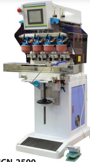
ICN-2500 4 colores