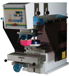
ICN B100 1 color, de mesa