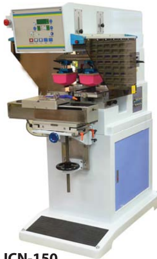
ICN-150 2 colores, copas de 150mm