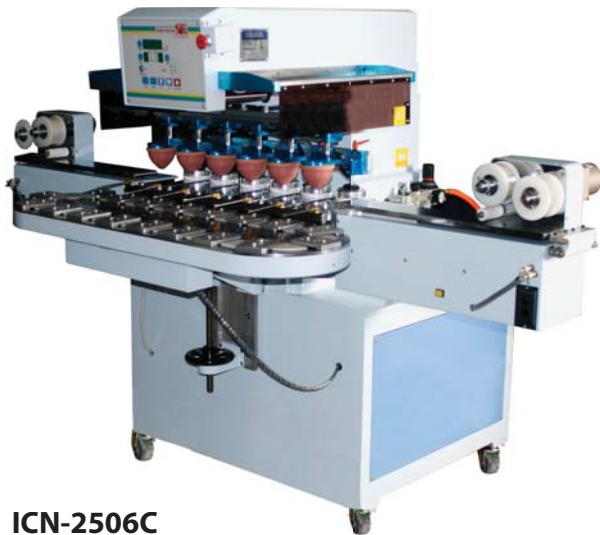
ICN-2506C 6 colores, con sistema de carrusel